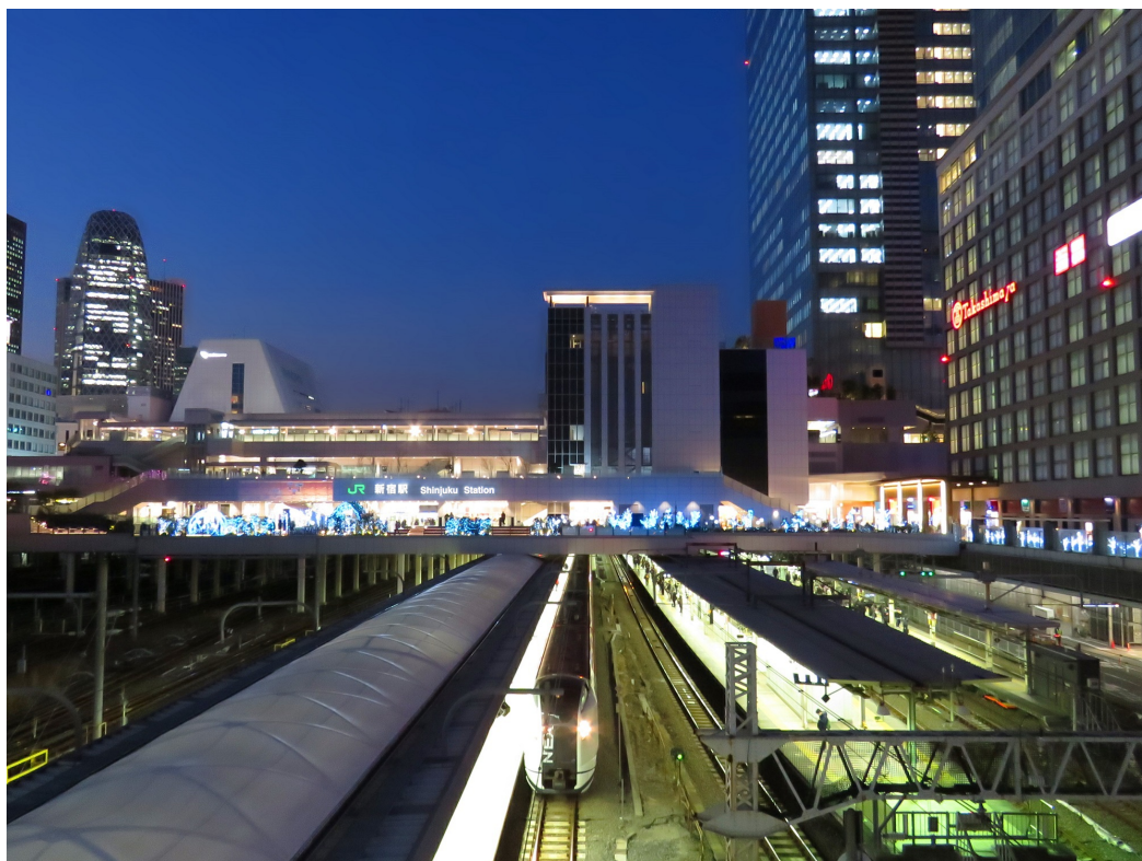
「個と調和」：14種類の発車ベルが単独で識別されつつも全体で調和される

オーチャードホール／シアターコクーン／ル・シネマ1／ル・シネマ2 東京体育館／新宿文化センター／NHKホール／メディアホール モーツァルトホール／フィリアホール／静岡県グランシップ シネマ2／シネマシティ／他