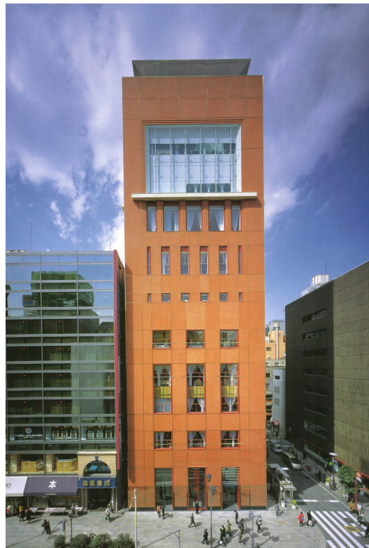
東京銀座資生堂ビル