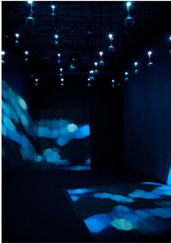
21_21 DESIGN SIGHT