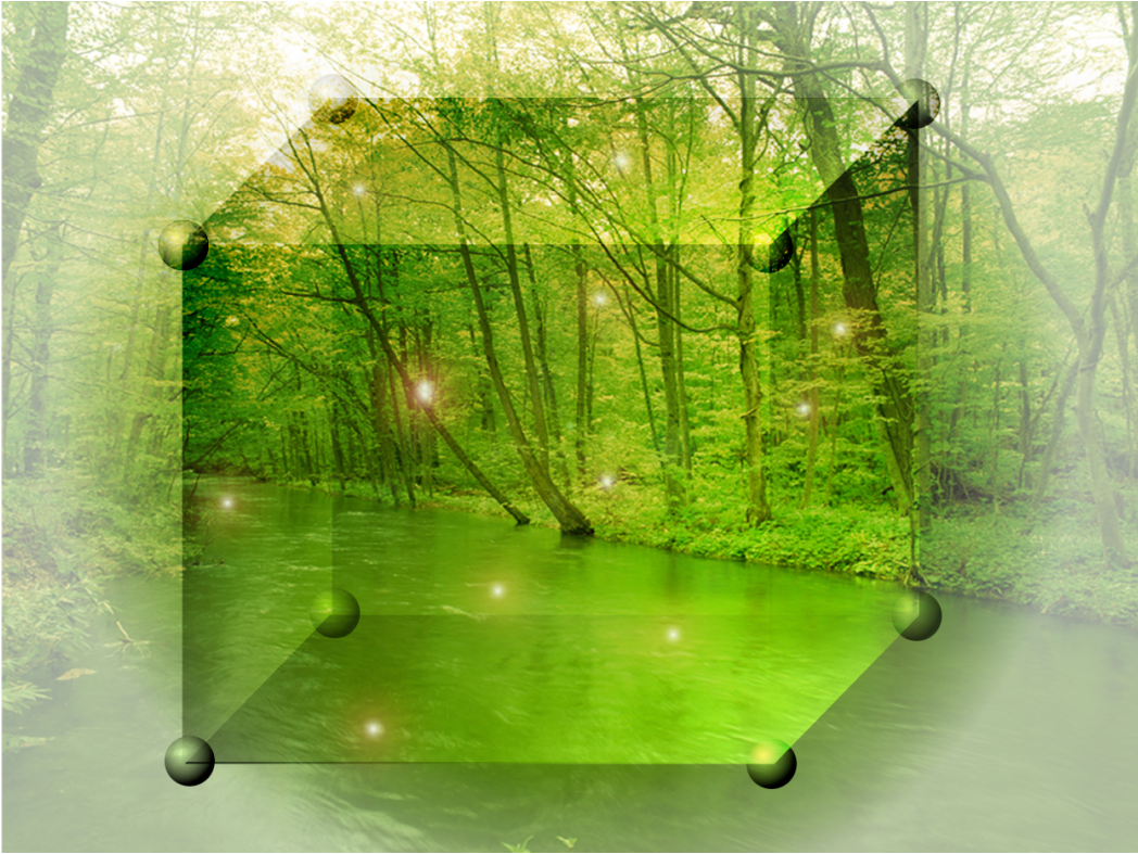
立体音響システム EL PHONIC