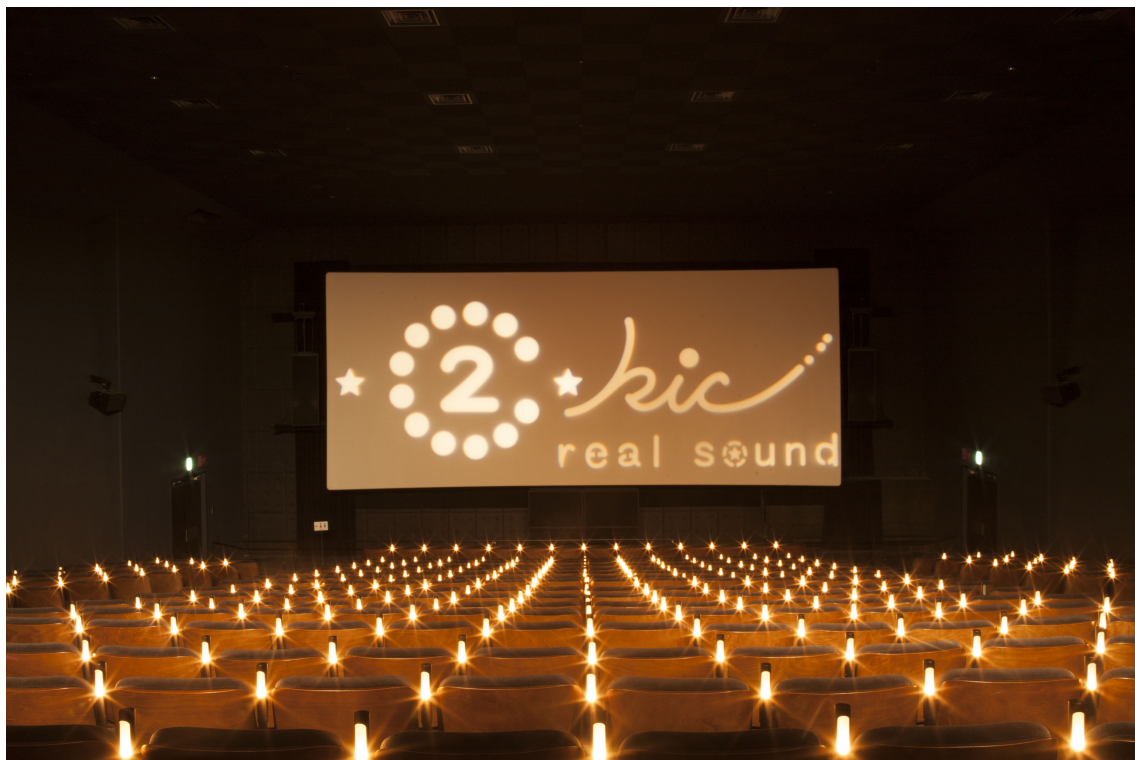
立川シネマシティ