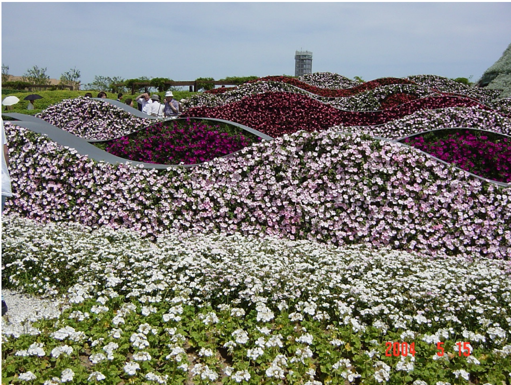
PACIFIC FLORA 2004 『浜名湖花博』